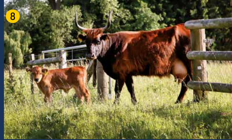
Heckrinder sind auerochsenähnliche Rinder, die zusammen mit robusten Konik-Pferden eine naturnahe, artenreiche Weidelandschaft entstehen lassen.