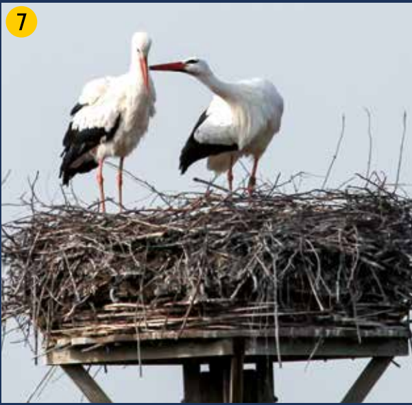
Erfolgreiche Storchbrut im Jahr 2013 – das Olfener Beweidungsprojekt ist Ursache für die Rückkehr des Weißstorchs auch in unsere Region.