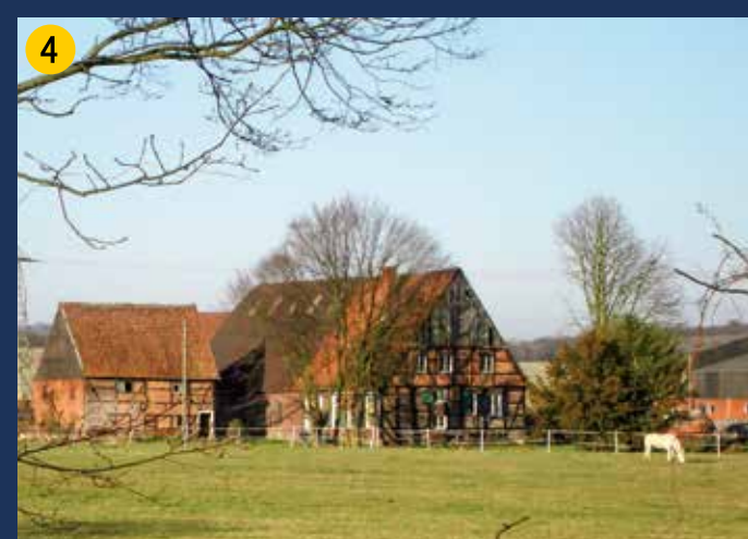
Hof Grube – Ältestes Fachwerkbauernhaus Norddeutschlands, dessen Wurzeln vermutlich 1000 Jahre zurück liegen. Die ältesten erhaltenen Bauteile stammen aus dem frühen 16. Jh., die Gebäude befinden sich in privater Hand und werden aktuell umfangreich renoviert.