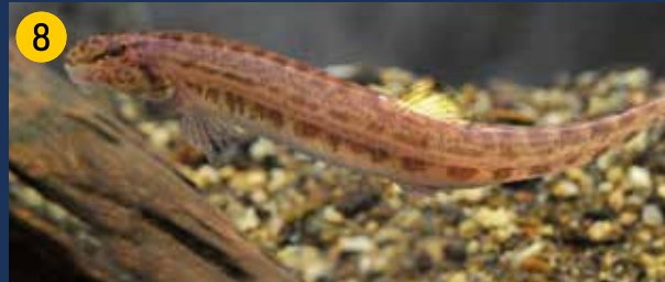
Steinbeißer sind 8 bis 10 cm große Fische, die am Grund naturnaher Fließgewässer leben. Zur Nahrungssuche benötigen sie „frisch“ von der Strömung umgelagerte Sande. Steinbeißer sind nacht- und dämmerungsaktive Fische. Sie ernähren sich, indem sie Sand „durchkauen“, Kleintiere und organisches Material daraus aufnehmen und den restlichen Sand durch die Kiemen wieder ausstoßen. Die wenigen Restvorkommen sind in NRW über die FFH-Richtlinie geschützt.