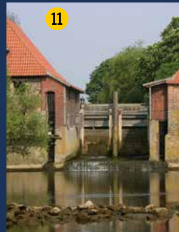
Die Füchtelner Mühle – malerisch und im Nebenfluss als kleines Wasserkraft-Werk genutzt. Durch den Bau einer Umflut ist hier 2015 die Durchgängigkeit der Stever für wandernde Fische wieder hergestellt worden.