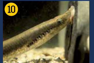
Flußneunaugen gehören zu den sogenannten Rundmäulern, sind also keine „echten“ Fische. Die erwachsenen Tiere (bis zu 50 cm lang) leben als „Außenparasiten“ im Meer, z.B. an Hering oder Dorsch. Wenn sie zur Laichablage in die Fließgewässer einwandern, wird der Darm zurückgebildet und keine Nahrung mehr aufgenommen. Der Laich wird in Wassertiefen von 0,3 bis 5 m in Laichgruben gelegt. Die Querder, so werden die augen- und zahnlosen jungen Neunaugen genannt, leben eingegraben im Flußbett und filtern organische Partikel und Kleintiere als Nahrung heraus. Nach 3 bis 5 Jahren wandeln sich die nun 5 bis 9 cm langen Tiere um zu erwachsenen Rundmäulern, die dann ins Meer wandern. Die Lippe beherbergt neben Rhein und Sieg die wenigen Vorkommen in Nordrhein-Westfalen.