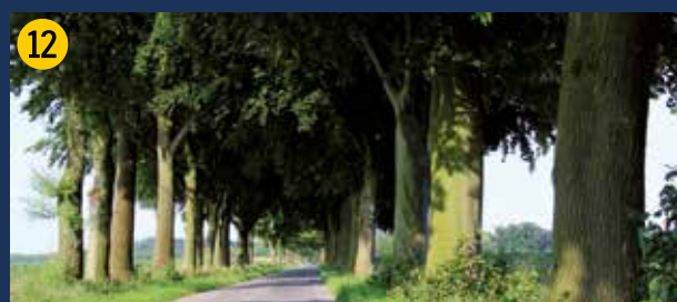
Alte Eichen- und Buchenallee zwischen Olfen und Seppenrade. Alleen als typisches Landschaftselement der Region. Alle Alleen in Nordrhein-Westfalen sind gesetzlich geschützt.