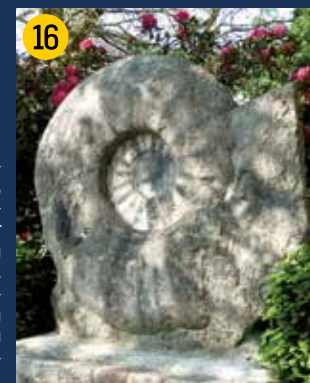
Seppenrader Ammonit – der weltgrößte (!) Ammonit wurde 1895 in der Bauerschaft Leversum gefunden. Er hat einen Durchmesser von rund 180 cm, eine Dicke von 40 cm und wiegt etwa 3,5 Tonnen. Das Original befindet sich im Landesmuseum für Naturkunde in Münster. Eine Nachbildung steht in Seppenrade im Bereich der Ampelkreuzung an der B 474.