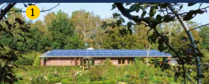
Biologisches Zentrum Kreis Coesfeld – steht seit 25 Jahren für Umweltbildung in der Region. Besucher sind herzlich eingeladen! Genießen Sie das Gelände – www.biologisches-zentrum.de .