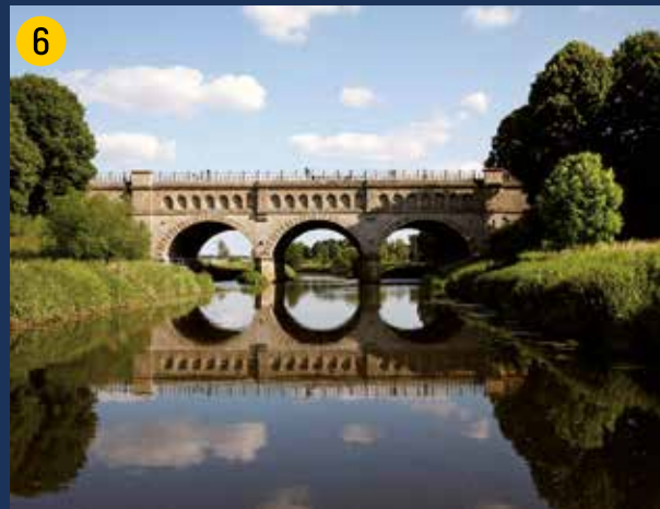
Historische Dreibogenbrücke – Inbetriebnahme 1899 – des ehemaligen Kanals über die Stever mit Blick auf den östlichen Teil des Beweidungsprojektes Steveraue.