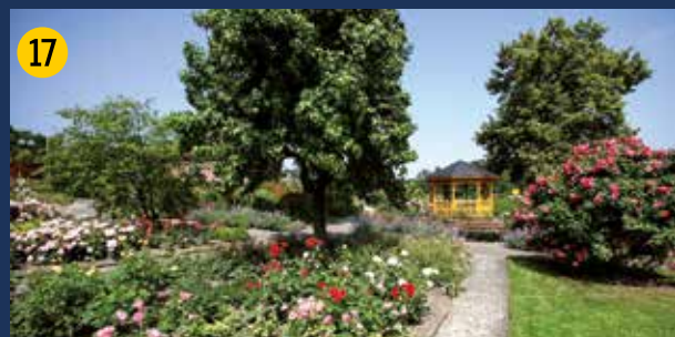
Seppenrader Rosengarten – er wurde vor 40 Jahren von engagierten Bürgern auf einer ehemaligen Mülldeponie angelegt und bis heute ehrenamtlich gepflegt – über 700 Rosensorten sind ein Besuchermagnet.