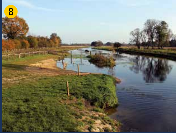
Blick in die „entfesselte“ Stever , deren Ufer nicht mehr technisch eingefasst werden (östlich der Füchtelner Mühle).