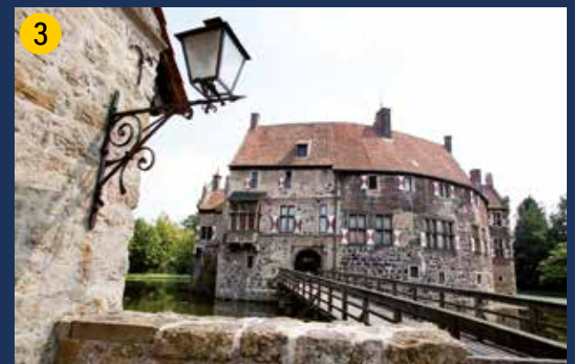
Burg Vischering – eine der schönsten Wasserburgen Deutschlands. Erstmals 1271 erwähnte Ringmantelburg mit Vorburg und weitläufigem Gräfensystem. Heute Münsterlandmuseum, mit wechselnden Ausstellungen in der Remise und Café in der Vorburg.