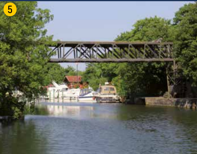
Der Olfener Yachthafen mit dem historischen Sperrwehr am Reststück der alten Fahrt zwischen Olfen und Lüdinghausen.

Die Lippe und ihre Aue sind die zentrale Ost-West-Verbindungsachse für Lebensräume und Arten im nordrhein-westfälischen Flachland. Sie ist auf einer Länge von rund 150 km zwischen Dorsten und Lippstadt fast vollständig als FFH- und Naturschutzgebiet ausgewiesen worden. Trotz der (noch) vorhandenen Uferbefestigungen bietet sie besondere Lebensräume für viele seltene Tier- und Pflanzenarten der Fließgewässer und Auen. Eine umfangreiche Renaturierung der Lippe und ihrer Aue soll künftig ihren Naturschutzwert weiter verbessern. Auch hier sollen Teilbereiche mit Heckrindern und Konik-Pferden genutzt und entwickelt werden.