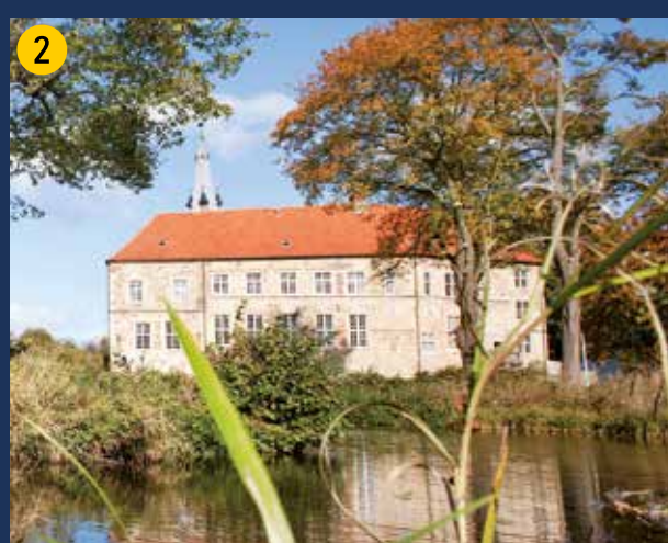
Burg Lüdinghausen – Renaissance-Wasserburg mit Ursprüngen im 12. Jahrhundert. Heute soziokulturelles Zentrum mit VHS, Ausstellungsräumen, einem romantischen Trauzimmer und Fahrradstation.