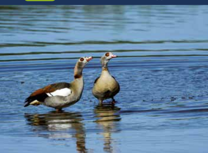
Nilgänse – Herkunft: Mittel- und Südafrika – die Art zählt zu den auffälligsten Neubürgern. Die heute hier lebenden Tiere stammen von ausgesetzten oder aus Zierhaltung entflohenen Exemplaren ab. Ihre starke Vermehrung und Ausbreitung in Europa begann Ende des letzten Jahrhunderts. Als häufiger Baumbrüter kann sie durch das Besetzen von Horsten zur Verdrängung von Störchen und Greifvögeln beitragen.