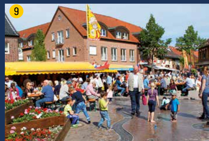
Olfen – der bunte Markt lädt ein zur Rast und einem Eis.

Der Radweg folgt mit dem Kleeblatt-Logo dem ausgeschilderten Wegenetz (rote Schrift, roter Pfeil, rotes Rad). Wo das offizielle Wegenetz verlassen wird, übernehmen die sechseckigen Schilder mit blauem Pfeil und blauem Rad die Wegweisung. Den GPS-Track finden Sie auf den Internetseiten der verschiedenen Partner des Projektes.